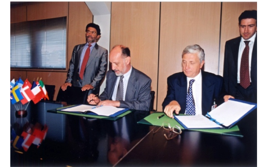
UNISPACE III - Vienna 1999

Sur la base du volontariat, sans échange de fonds